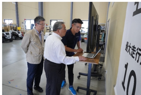
FMS コンソールの操作体験