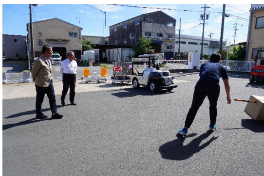
障害物による安全性の確認