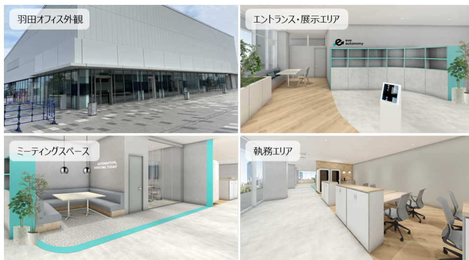
eve autonomy 羽田オフィスの所在地と概観（イメージ）

HANEDA INNOVATION CITY ゾーン H 2 階 [店舗番号：H2-1]