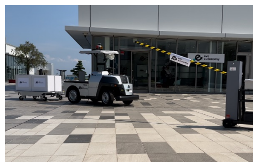
電動ゲートとの通信による自動連携