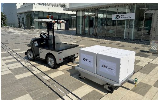
オフィス前での無人搬送デモンストレーション