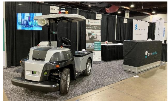
MODEX2024 eve autonomy ブース